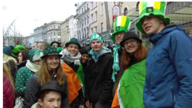
St. Patricks day in Cork