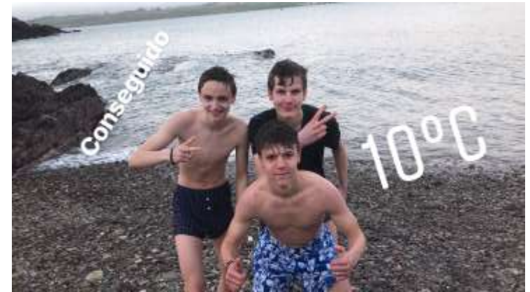
Baden im April