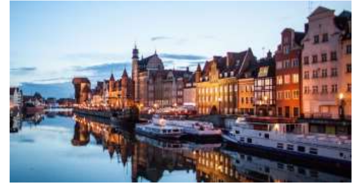
Gdansk - Danzig