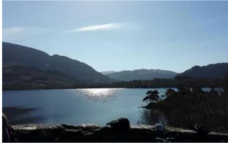
Fahrradtour im Nationalpark