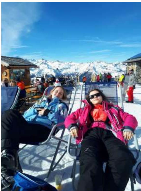
Ski fahrt nach Italien